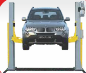
جک دو ستون