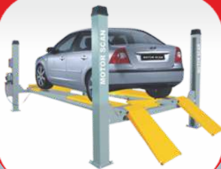
جک چهار ستون