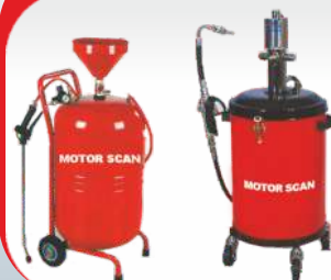
گریس پمپ بادی گف پاش