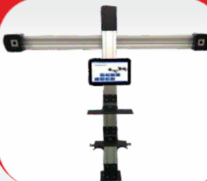
میزان فرمان 3D