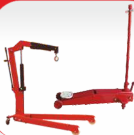
جک سوسماری جک موتور دار