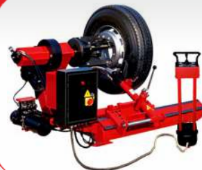
لاستیک در آر سنگین