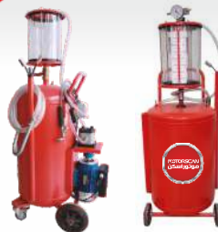
ساکشن روغن بادی و برقی